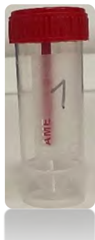
1 amostra/ 1º dia

Exame parasitológico em 3 amostras, 1 amostra por cada dejeção: