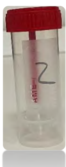
1 amostra/3º dia