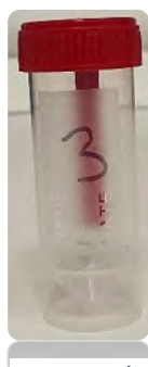
1 amostra/3º dia