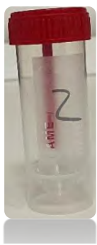
1 amostra/2º dia